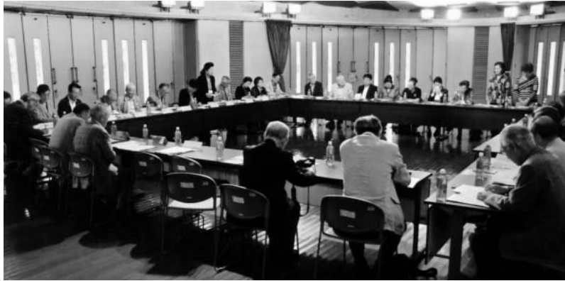
(交流会：於 犬山市「さら・さくら館」)