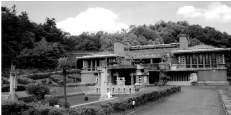
(明治村：帝国ホテル)

そのホールは大きな円形で中心の天井より沢山のライトが四方を照らす素敵な会議場でした。(皇居の吹上御所を設計した方の作とか)、夕方激しく降る雨の中お互