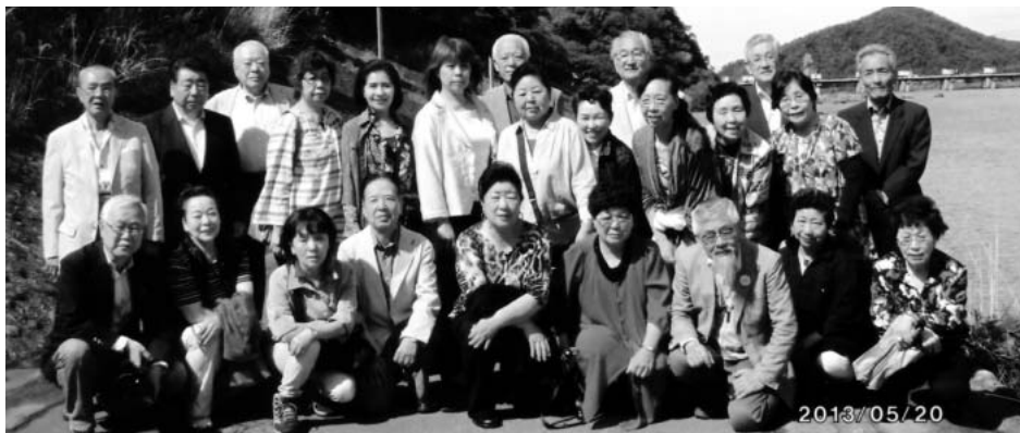
(集合写真：木曾川のほとり)

共通の問題として行政との関係活動資金、会員の高齢化や新会員の確保など話合いました。その他